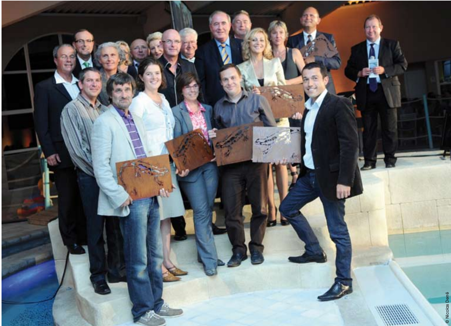
Tops du tourisme : les nouveaux visages du tourisme Loir-et-Chérien

Pour assurer son développement, le Loir-et-Cher doit valoriser ses atouts naturels, historiques. Le Conseil général mise sur une image renouvelée du département pour développer le tourisme et attirer les investisseurs.