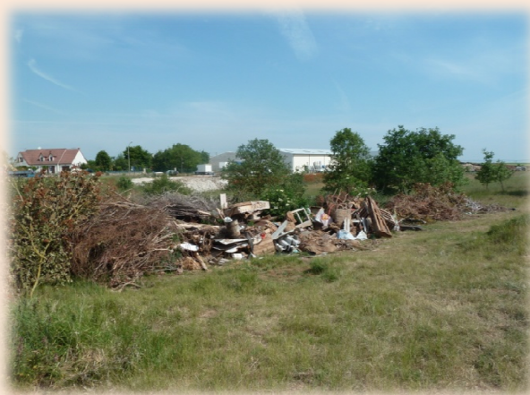
Décharge sauvage observée le 20 mai 2011