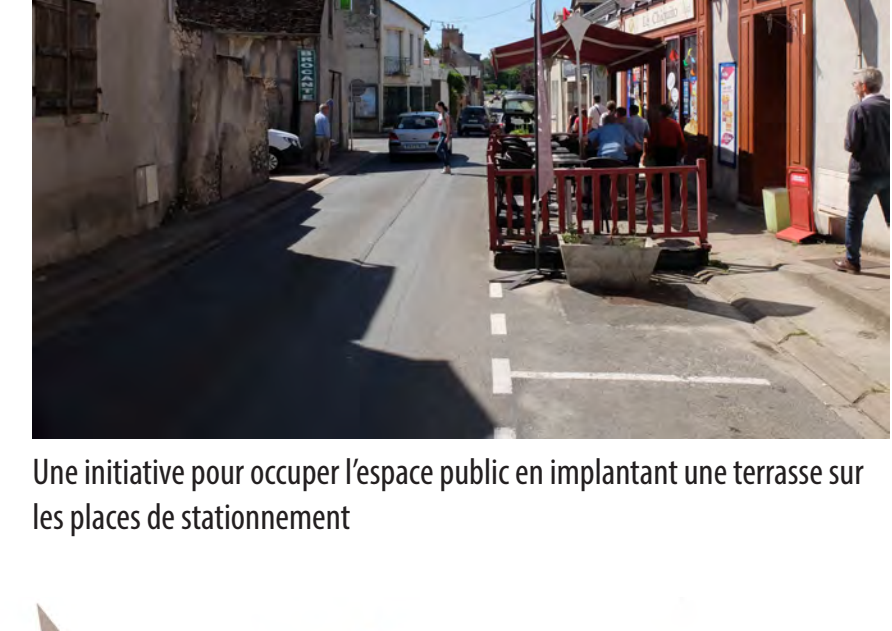
Une initiative pour occuper l'espace public en implantant une terrasse sur les places de stationnement