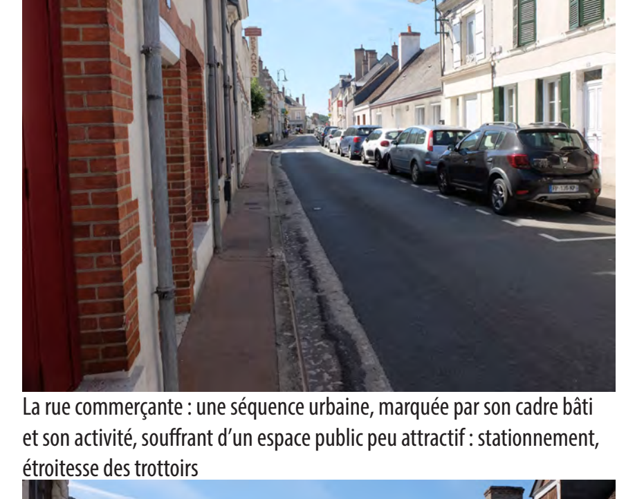
La rue commerçante : une séquence urbaine, marquée par son cadre bâti et son activité, souffrant d'un espace public peu attractif : stationnement, étroitesse des trottoirs