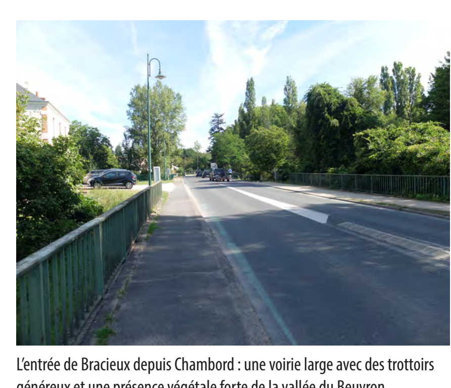
L'entrée de Bracieux depuis Chambord : une voirie large avec des trottoirs généreux et une présence végétale forte de la vallée du Beuvron

SEQUENCE 1bis SEQUENCE 1 SEQUENCE 2 SEQUENCE 3