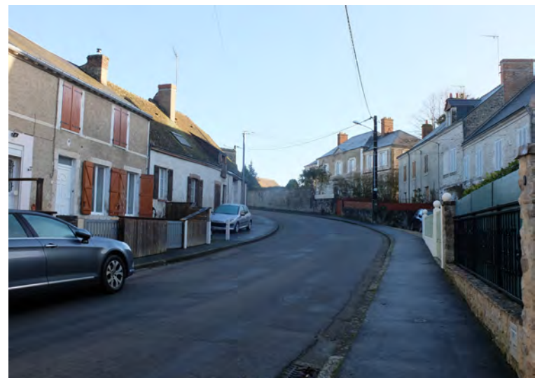
La rue de l'Abreuvoir souligne l'implantation en promontoire et la montée concentrique vers le cœur de bourg.