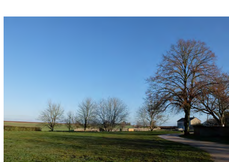
A l'arrière de la mairie, un vaste espace ponctué de beaux arbres, présente une lisière arborée très qualitative qui s'ouvre sur l'espace agricole beauceron - l'occasion de réaménager les accès à l'école et un lieu de partage d'usages ?