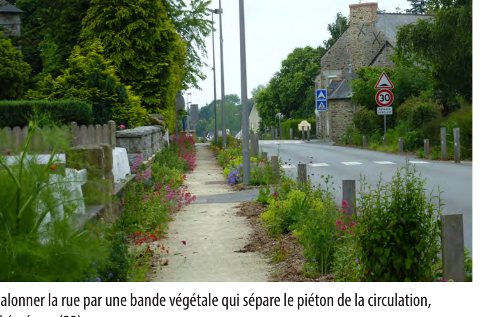
Jalonner la rue par une bande végétale qui sépare le piéton de la circulation, Trémereuc (22)