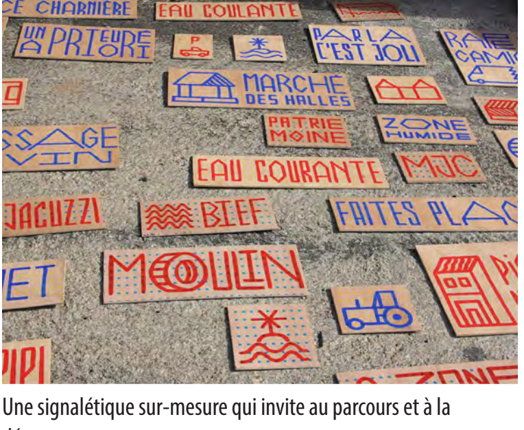
Une signalétique sur-mesure qui invite au parcours et à la découverte