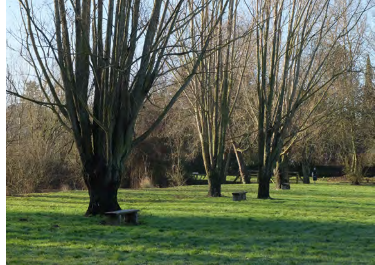
La vallée de l'Aigre et ses anciennes troignes de saules, comme composantes de la structure paysagère et vestiges de l'exploitation agricole des anciens marais