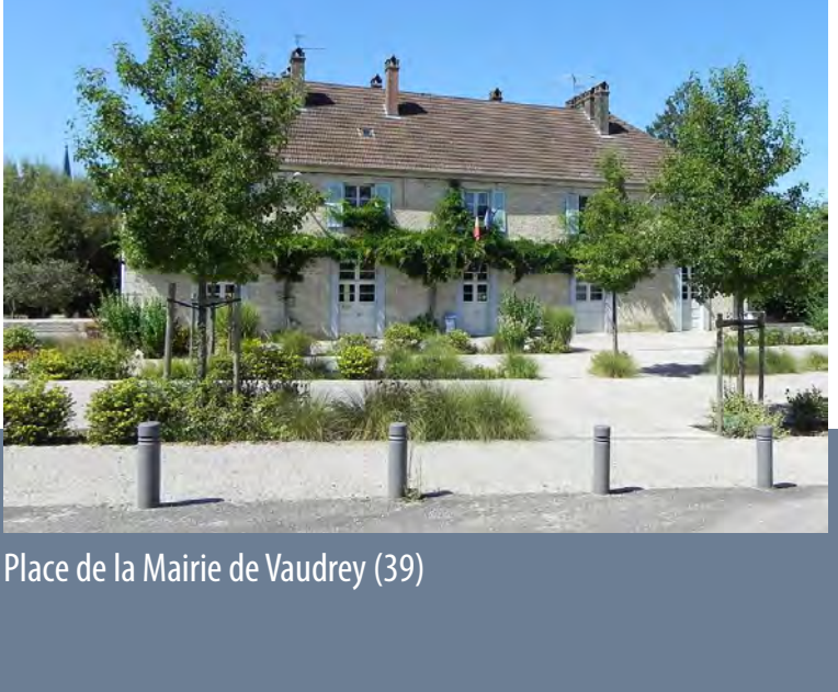
Place de la Mairie de Vaudrey (39)