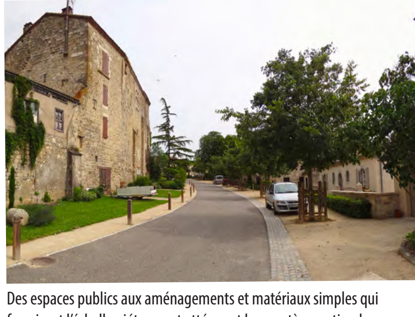
Des espaces publics aux aménagements et matériaux simples qui favorisent l'échelle piétonne et atténuent le caractère routier de certaines rues au profit de la valorisation patrimoniale, Praysac (46)