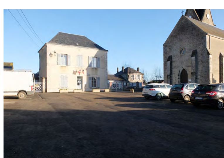
La place de l'église, point haut du village, sujette à des déséquilibres d'usages, notamment concernant la place donnée aux véhicules