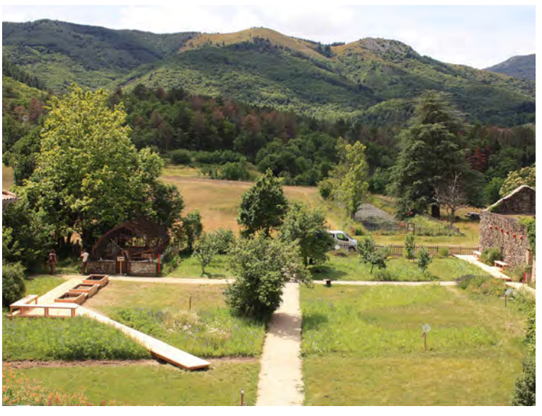
Un espace de partage ouvert sur le grand paysage, Jardin du PNIRMA à Jauges (07)