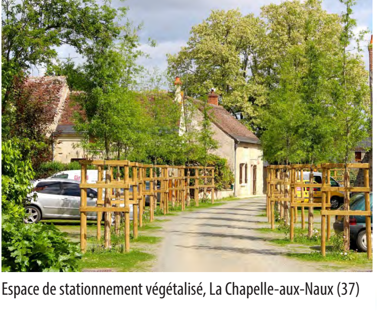
Espace de stationnement végétalisé, La Chapelle-aux-Naux (37)