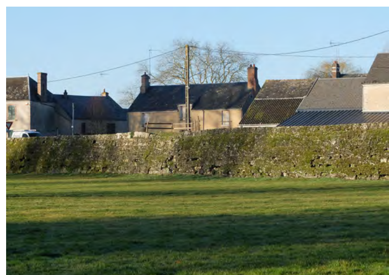
La chaussée-digue est un des plus importants vestiges antiques du département, qui rend visible au cœur du bourg de Verdes l'existence d'une des voies antiques qui traversent la commune et justifient le nom de Beauce la Romaine