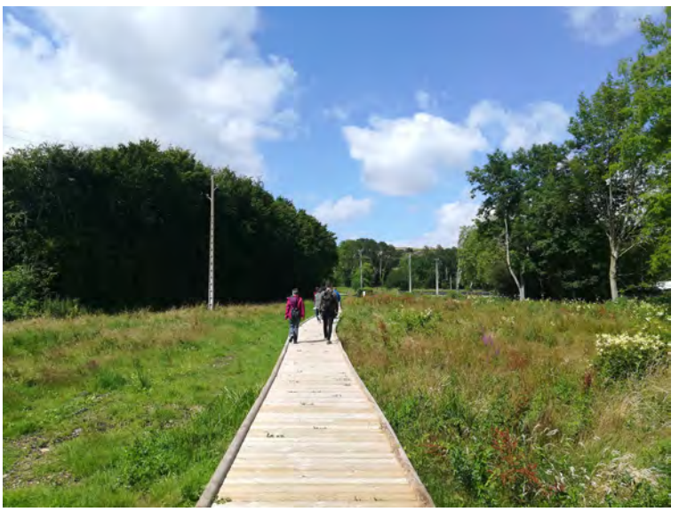
Une passerelle/ponton pour un accès à toutes les mobilités au sein d'une zone humide, Sargé-sur-Braye (41)