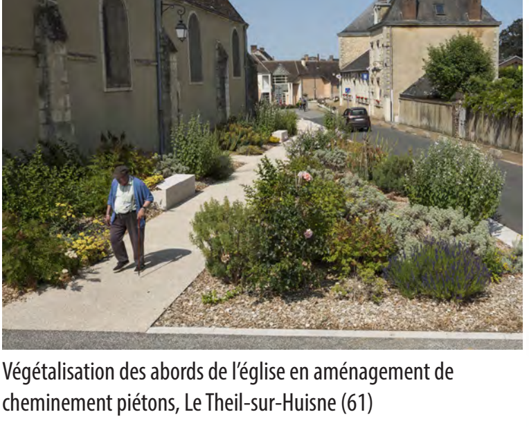
Végétalisation des abords de l'église en aménagement de cheminement piétons, Le Theil-sur-Huïse (61)