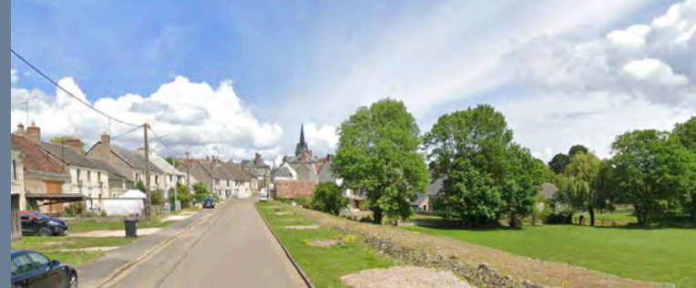
La chaussée-digue souligne la perspective d'entrée vers le cœur de bourg en promontoire au-dessus de la vallée